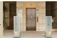
六本木 kappou ukai