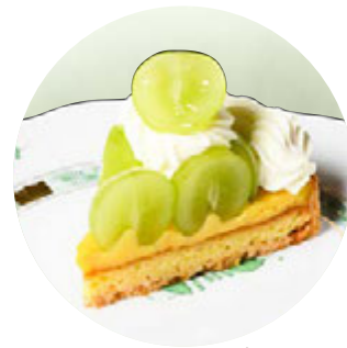
タルトセゾン シャインマスカット

アンズジャムを挟んだチョコレート生地に、 シャリシャリ食感のチョコレートを掛けて。