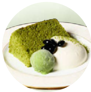
抹茶のシフォンケーキ