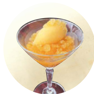
せとかのナージュ