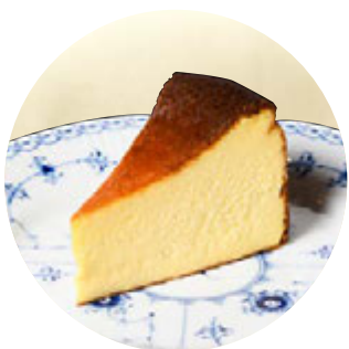
バスクチーズケーキ