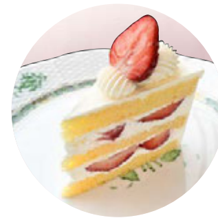
プレミアムショートケーキ

厳選した国産イチゴをふんだんに使用。 コク深いクリームと共に贅沢にサンドした、 ジューシーで軽やかな一品。