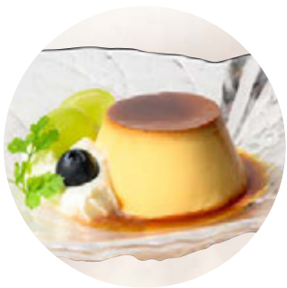
プリン・ア・ラ・モード

厳選した国産イチゴをふんだんに使用。 コク深いクリームと共に贅沢にサンドした、 ジューシーで軽やかな一品。