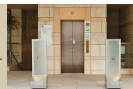
六本木 kappou ukai